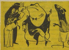
Рис. С. АНТОНОВА