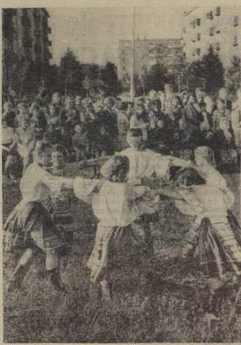
Молдавский танец — как вихрь. Яркая, захватывающая мелодия подхватила девочек, понесла по ветру. Под их ногами — не паркет, не сцена клуба, обыкновенная гравя. Плещут девчонки на улице подмосковной деревни Марфино. Не удивляйтесь деревни! В этих многоэтажных домах живут рабочие совхоза «Менченинг». Над совхозом существует Дом культуры города Догородного. Девочки, так покорившие зрителей, занимаются в этом Доме культуры в танцевальном кружке.

Нужно ли говорить о том, что между идеями и её воплощением дистанция немалая! Требуемый автомат ещё не сделан. Но видно другое. Участники конкурса «Арти, выдумай, пробуй!» — ребята 5—7-х классов — не боялись взяться за сложную тему и доказали свою способность к техническому мышлению. Радеет умение ребят изложить свои мысли в виде принципиальной схемы и чертежа, что, в общем, доступно не каждому взрослому. А навыки в творческом конструировании закрепляются за человеком навсегда, так же, как умение плавать или ездить на велосипеде... И. ЭЛЬШАНСКИЙ, изобретатель.